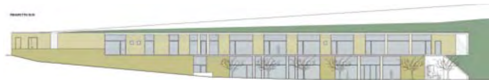
A LATO, DALL'ALTO: PROSPETTO A VALLE, PIANTA DEL PRIMO LIVELLO, SEZIONI TRASVERSALI DI PROGETTO. NELLA PAGINA A FIANCO: VEDUTA DEL LIVELLO SUPERIORE DEL CENTRO CON IL TERRAZZAMENTO.